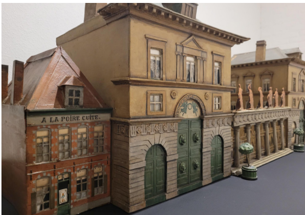
Maquette de la manufacture Piat-Lefebvre.