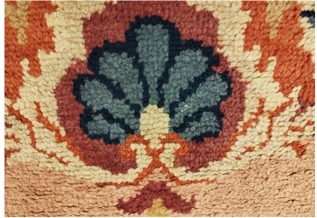
Palmette . Détail du tapis de la manufacture Leveugle.