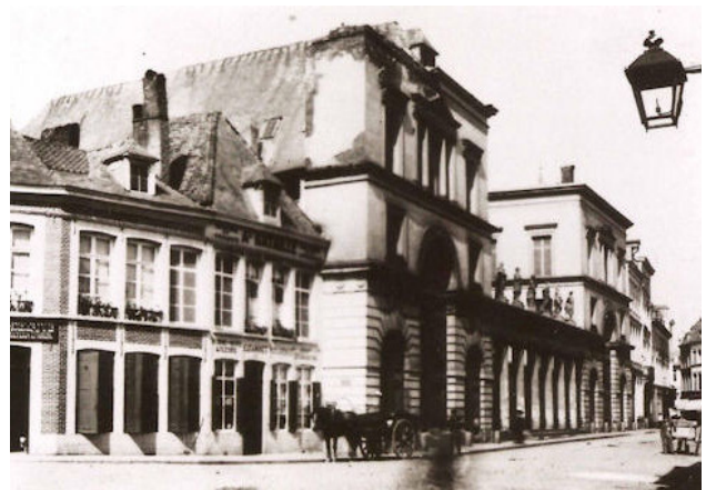
Fabrique de tapis Piat-Lefebvre, vue de la façade, rue des Clairisses, début du 20 e siècle.