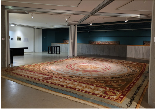
Le tapis Empire , Manufacture Piat-Lefebvre, 1810.