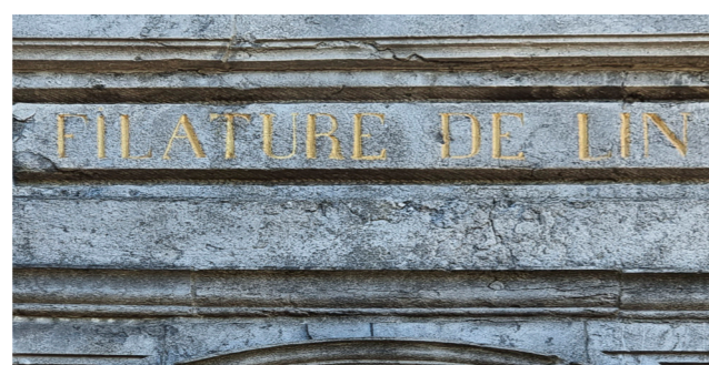
Rue des Sœurs de Charité