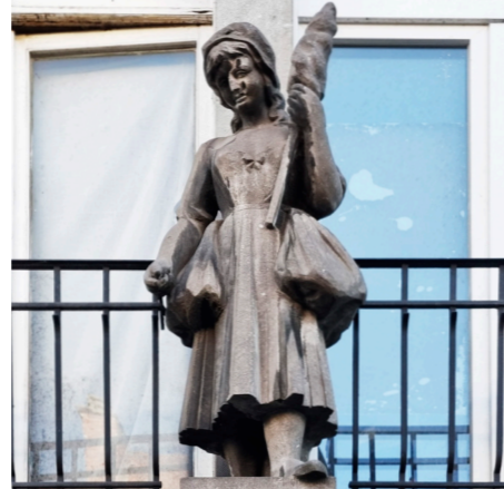
Rue de Pont, 25

De naam van een vooroorlogs café werd behouden na de wederopbouw en versierd met dit stenen beeld. De herderin met haar staf geeft een dramatische situatie weer: haar moord door een vrijer op het platteland van Ivry. De moordenaar werd tot de dood veroordeeld op de place de Grève in Parijs. Over de affaire werd uitgebreid geschreven in de pers, maar er werden ook liedjes, boeken, toneelstukken over geschreven en het inspireerde Victor Hugo voor zijn pleidooi tegen de doodstraf Le dernier jour d'un condamné , dat in 1829 verscheen.