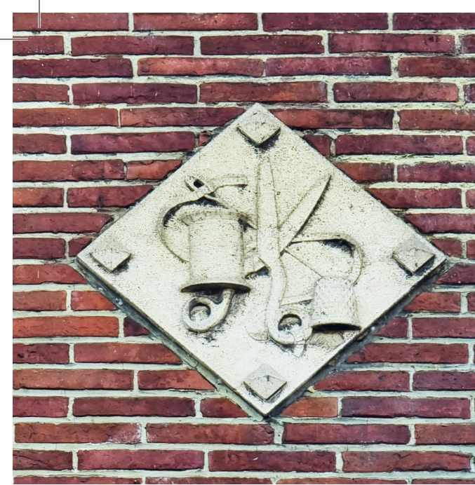
Rue des Puits l'Eau, 12