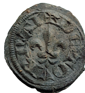
Loodzegel gevonden in Oost-Europa.