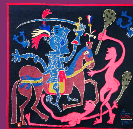
Pierre Caille, Chevaux, manants, chevaliers (detail), 1984 - verz. TAMAT

Uit deze bedrijvigheid zijn verschillende organen ontstaan, waaronder TAMAT in 1981 en in 1982 Les Ateliers Tournaisiens de Tapisserie, terwijl de scholen voor kunst en hoger onderwijs creatieve opleidingen bieden, op basis van tapijtwerken, textieldesign en stylisme.