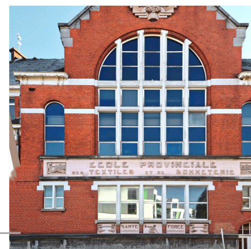
Rue Paul Pastur, 2