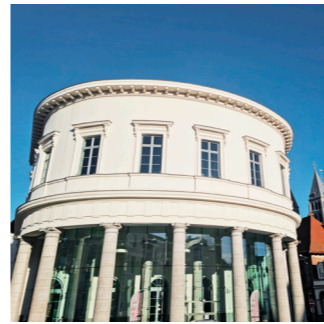
▲ Muziekconservatorium ▲ Joseph Lacasse, Tapisserie bleue et rouge, 1972. Verz. Federatie Wallonië-Brussel TAMAT

Het plein bij het park werd in de 19 e eeuw aangelegd, tijdens de grote werkzaamheden die in die tijd in de stad werden uitgevoerd onder leiding van Bruno Renard. In 1823 vond hier de textielmarkt plaats, later werd het de plek voor de verkoop van linnen. In 1864 installeerde de markt voor geweven stoffen zich op dit plein, een markt die later naar achter de Lakenhal wordt verplaatst.