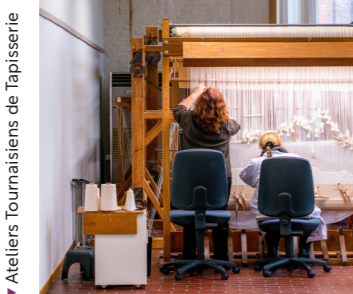
Ateliers Tournaisiens de Tapisserie