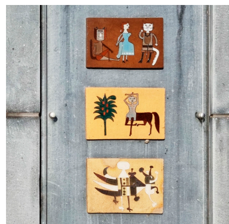
Rue Pierre Caille

Deze straat is vernoemd naar de kunstenaar die in Doornik geboren werd (1912-1996). Keramist, beeldhouwer, maker van collages, sieraden en emaille voorwerpen, een kunstenaar die passie had voor alle vormen van decoratieve kunst. In de collecties van TAMAT, laten de tapijtwerken en borduurwerken de gebruikelijke sfeer van zijn creaties zien, ook zichtbaar op de keramiek aangebracht op de muur van Qualias . De creaties weerspiegelen een fantastische en dromerige wereld getint door ironie en spot, zeer eigen aan de kunstenaar.