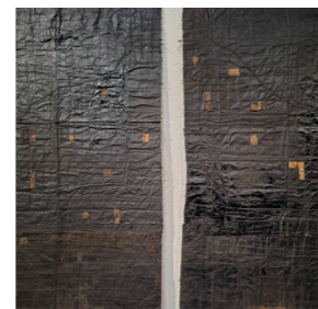
Yolande PISTONE (Binche, 1961)