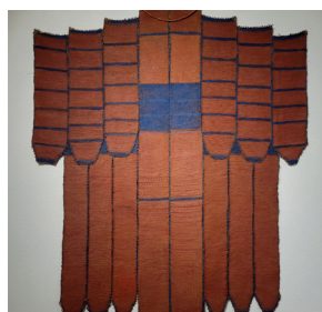
Juliette ROUSSEFF (Liège, 1943)

Cette démarche évoque cette époque d'essais et d'expériences : Juliette Rousseff met en œuvre et teint des matières naturelles non filées (sisal, jute, lin, chanvre). Ses tissages se veulent un « code de langage à décrypter » : l'artiste joue sur la signification symbolique voire rituelle de l'acte textile et laisse à ses créations leur face cachée et mystérieuse.