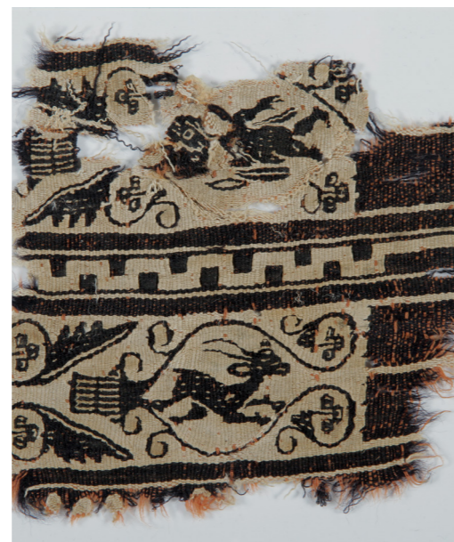
Tissu copte, détail.