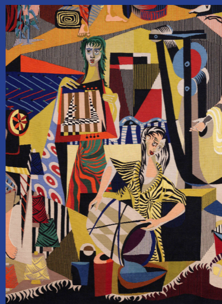
Michel Holyman, Activités textiles, les métiers , détail.

L'aventure de la tapisserie peut naître à Tournai !