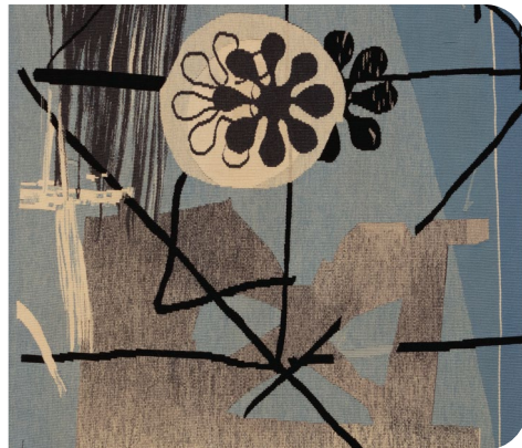
Femmes artistes et tapisserie belge