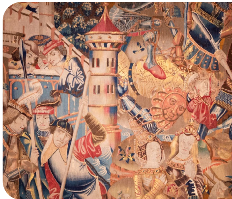
Les collections du musée

MOYEN ÂGE / RENAISSANCE / HISTOIRE / TECHNIQUE